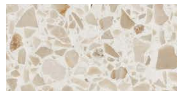
lucido / polished / poliert