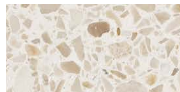
levigato / honed / geschliffen