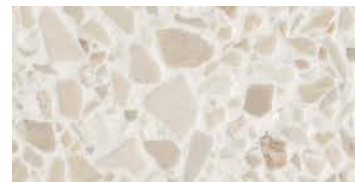
spazzolato / brushed / gebürstet