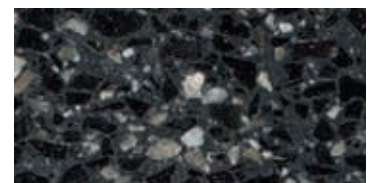
lucido / polished / poliert