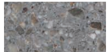
levigato / honed / geschliffen