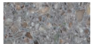
spazzolato / brushed / gebürstet