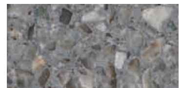
lucido / polished / poliert