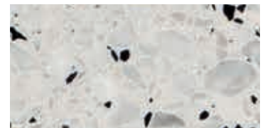
levigato / honed / geschliffen