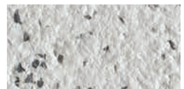
bocciardato / bush-hammered / gestockt