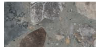
lucido / polished / poliert