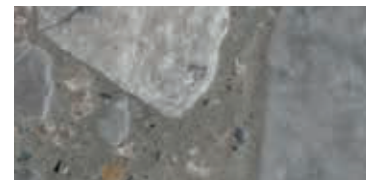
spazzolato / brushed / gebürstet