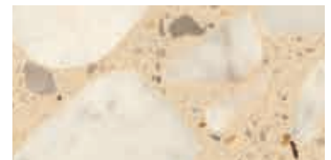
levigato / honed / geschliffen