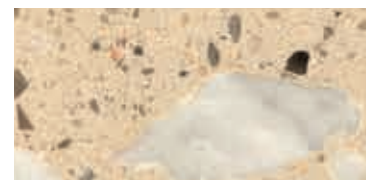
lucido / polished / poliert