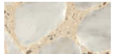
spazzolato / brushed / gebürstet