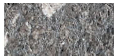
bocciardato / bush-hammered / gestockt