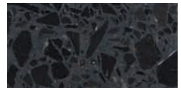
levigato / honed / geschliffen