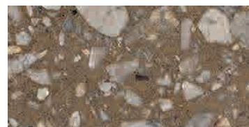
levigato / honed / geschliffen