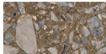
spazzolato / brushed / gebürstet