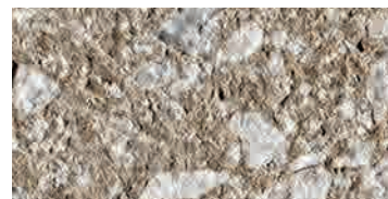
bocciardato / bush-hammered / gestockt