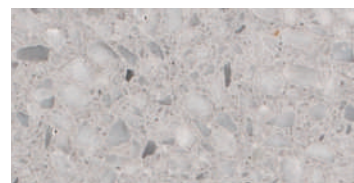
levigato / honed / geschliffen