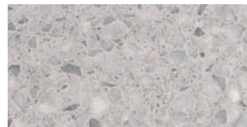
spazzolato / brushed / gebürstet