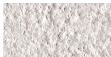
bocciardato / bush-hammered / gestockt