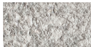
bocciardato / bush-hammered / gestockt