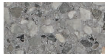
spazzolato / brushed / gebürstet