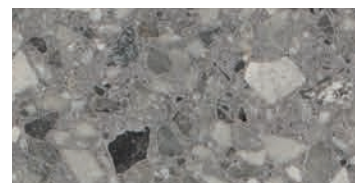
levigato / honed / geschliffen